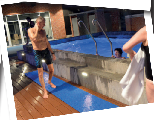
Det kolde gys!