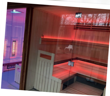
Sauna og dampbad