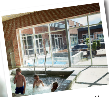
Wellness for alle

Ledsagere og personer der ikke spiller har også mulighed for at benytte faciliteterne og deltage i workshop med fællesskab · velvære · oplevelser