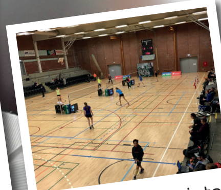
Masser af badminton